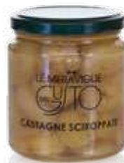
CODICE F00007 peso: 350 g

Le Castagne in sciroppo sono un insolito antipasto; consigliamo di colarle dal loro sciroppo e servirle su un tagliere misto di affettati (eccezionali avvolte nel lardo). Ideale l'abbinamento con formaggi, sono anche ottime come dessert da sole o con il gelato.