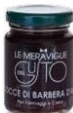
CODICE F00010 peso: 100 g

Le Gocce di Barbera d'Alba sono ottime per accompagnare salumi e secondi piatti. La corposità del vino Barbera consente di ottenere un prodotto veramente eccezionale da usare con formaggi morbidi o di media stagionatura. Ideale per crostate e torte. Deliziosa gustata da sola.