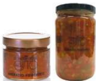
CODICE F00042 peso: 280 g CODICE F00056 peso: 1,5 kg

L'Antipasto Piemontese è un misto squisito di ben otto verdure amalgamate con il pomodoro. Da servire come antipasto tale e quale, o arricchito con tonno oppure uova sode. Ottimo per bruschetta.