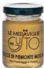
CODICE F00002 peso: 100 g

Le Gocce di Piemonte Moscato sono una confettura profumata, gustosa, floreale. Da usare con formaggi erborinati o stagionati. Ottima con il foie-gras ed il pesce crudo. Ideale con torte di ricotta, di semolino o per crostate. Accattivante gustata da sola.