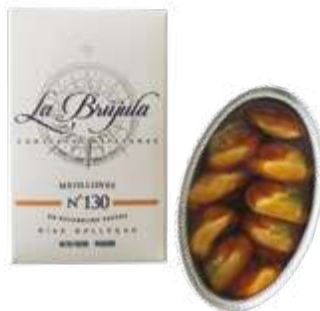
CODICE 700676 peso: 120 g (16/20 pezzi)