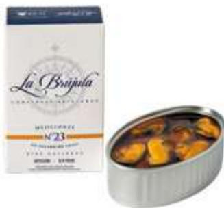
CODICE 700608 peso: 120 g (8/12 pezzi)