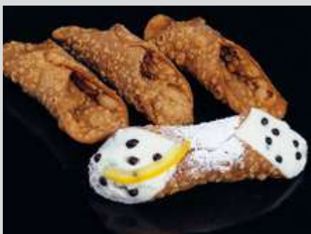
CODICE CE0003 peso: 4 x 112 g

I Cannoli della pasticceria Cerniglia sono preparati ancora oggi seguendo la ricetta del 1972; la tipica cialda arrotolata, realizzata con ingredienti semplici (farina, sale, strutto, vino rosso e cacao) è pronta per essere riempita con la crema di ricotta di pecora arricchita con pepite di cioccolato. Ottimi in abbinamento ad un Marsala.