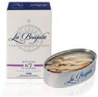
CODICE 700644 peso: 120 g (6/8 pezzi)