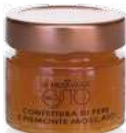
CODICE F00053 peso: 350 g

La Confettura di Pere e Piemonte Moscato è una fantasia di profumi e sapori da accostare a formaggi erborinati e di media stagionatura. Si abbina perfettamente con grana, gorgonzola, raschera, pecorino, robiola, fontina. Ottima spalmata sul pane per colazioni e merende o per deliziose crostate.