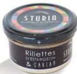
CODICE STU502 peso: 90 g

Da degustare su del buon pane, accompagnato da una bella insalata, rivela tutta la finezza dello storione insaporito dall'aroma fruttato e acidulo dello yuzu.