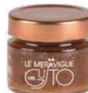
CODICE F00054 peso: 350 g

La Confettura di Fichi e Barolo viene realizzata con il re dei vini che va ad esaltare la polpa dei fichi. Da abbinare a formaggi di media e lunga stagionatura anche piccanti. Ottima con la robiola di Roccaverano stagionata, Bra duro, Castelmagno, taleggio, ma anche spalmata sul pane per colazioni e merende o per deliziose crostate.