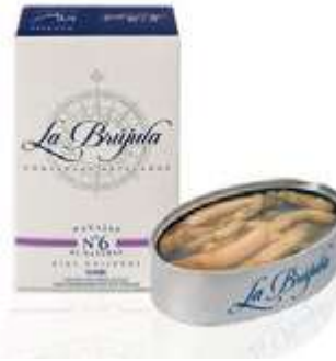
CODICE 700639 peso: 120 g (4/6 pezzi)