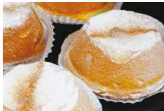
CODICE CE0017 peso: 15 x 90/100 g

La cassata al forno è un dolce tipico siciliano: un guscio di morbida pasta frolla con un ripieno di ricotta di pecora e gocce di cioccolato fondente.