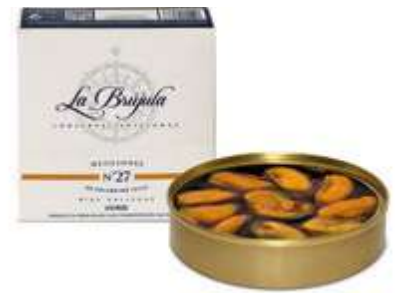
CODICE 7612DO peso: 120 g (8/10 pezzi)