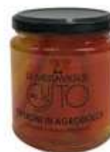
CODICE F00044 peso: 300 g

I Peperoni in agrodolce sono un eccezionale binomio tra i carnosi peperoni ed il miglior vino bianco del Roero. Ottimi da consumarsi da soli, guarniti con acciughe o creme delicate. Passati in forno sono un delizioso contorno.