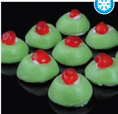
CODICE CE0005 Mignon 9 pezzi peso: 9 x 33 g