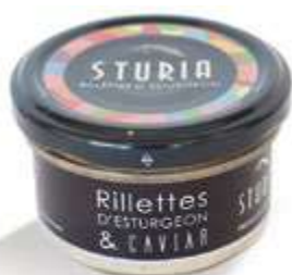
CODICE STU500 peso: 90 g

Le rillettes di storione e caviale rivisitano il mito: il gusto autentico dello storione e la finezza dei suoi grani di caviale all'interno di una rilette untuosa. Perfette su una fetta di buon pane, accompagnate da una insalata condita con un ottimo aceto.