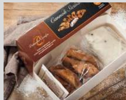
CODICE CE0004 Mignon 8 cialde peso: 8 x 50 g