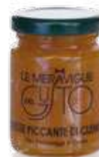
CODICE F00048 peso: 125 g