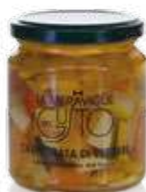
CODICE F00011 peso: 280 g

La Carpionata di verdure è fresca, stuzzicante, appetitosa. Ideale come antipasto o in accompagnamento ai salumi. Ottimo contorno per carni.