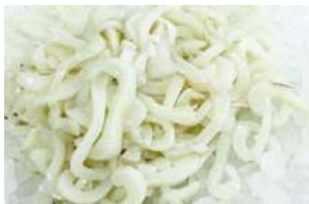
COD SEPTAGL peso 250 g

Le tagliatelle di seppia sono un crudo di pesce tra i più conosciuti; si ottengono da seppie adulte, dalla consistenza più tenace, che vengono affettate a listarelle, per assomigliare al classico formato di pasta, e quindi abbattute per mantenere intatti i sapori e consentirne la degustazione a crudo con l'aggiunta di un filo di olio extravergine, succo di limone e sale.